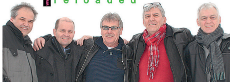
„dr. music reloaded“